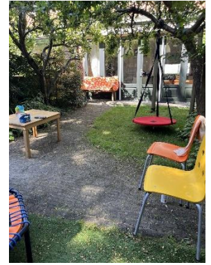
Tuin, maandagmiddag 22 juni, 15:50 uur, 27 graden

In de tuin van De Stampertjes is het heerlijk schaduwrijk en goed toeven. Met geopende tuindeuren en de ventilator volop aan, kan de koelere lucht vanuit de tuin het huis binnen wat aangener maken. We houden verder alle gordijnen dicht waar de zon op staat en zetten de air-cooler al in de ochtend in de slaapkamer aan zodat de kinderen 's-middags in een koele kamer kunnen slapen. We laten de kinderen lekker in de tuin met water spelen in het badje of bijvoorbeeld met de waterbaan. En een ijsje gaat er ook altijd wel in! Ja, het zal warm zijn, maar thuis is het ook warm en er zijn gezinnen die niet zo'n lekker schaduwrijk tuintje hebben waar de kinderen op zo'n warme zomerse dag lekker met water kunnen spelen.